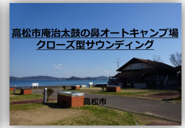
サウンディングの資料