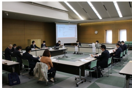
画像（会員投票の際のサムネイル）

まずは、PPP/PFIの機運醸成を目的に地公体職員の業務知識向上セミナーを開催。その後、2021年1月に「地域プラットフォーム」を設立し、官民ともに制度理解を深め、同年10月に官民対話を実施。