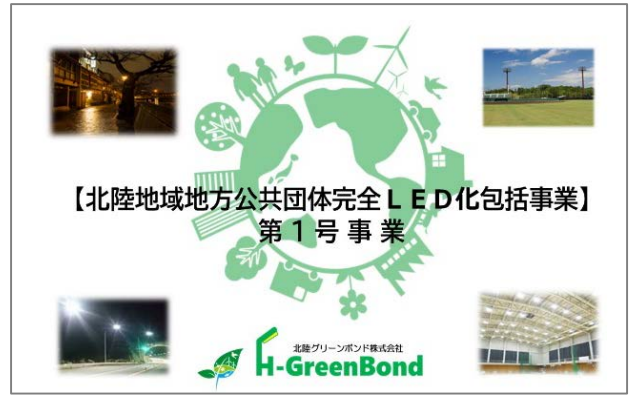
北陸グリーンボンド株式会社