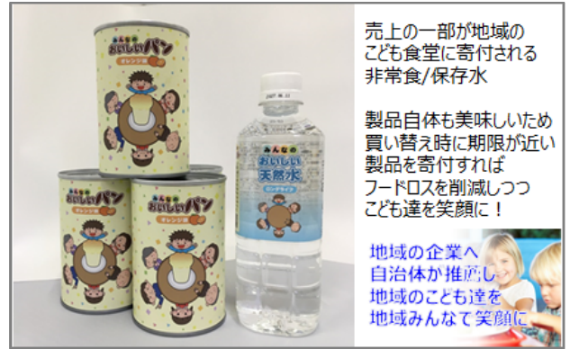
一般社団法人子ども食堂支援機構

【システム無償提供による被災地支援】 位置情報×CRMの独自技術で罹災証明書のスピード交付を実現