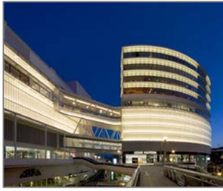
柏駅前の商業集積地